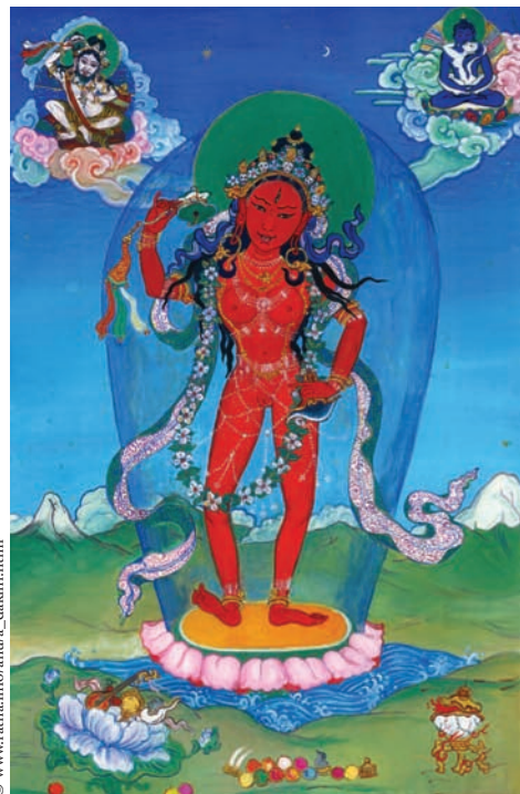
Yeshe Tsogyal, eine Gefährtin von Padmasambhava, in einer roten Erscheinungsform. Gemalt von Rudin Kondo, Nyingma Gruppe Österreich